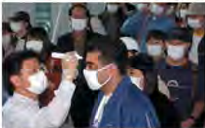
アジアの空港での使用

サーモフォーカスプロは、電源のオフが設定できます。使用後に電源をオフにするか、或いは使用後約4時間で電源をオフにするかを設定でき、電源を節約します。